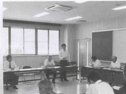
▲縄田赤中学校校長から学校教育の現状について説明がありました