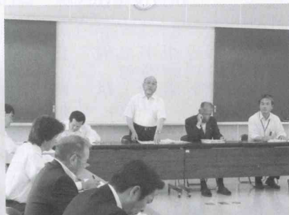
▲議事を進行する赤村小中一貫教育促進協議会会長の春岡副村長(中央)