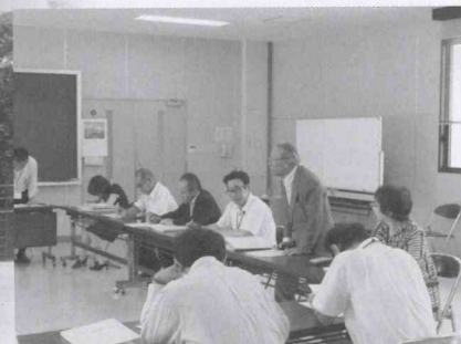
▲活発な議論をする委員