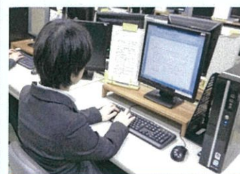
OA事務科(パソコン入力)