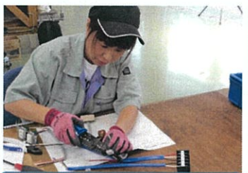
電気工事科(電気配線工事)