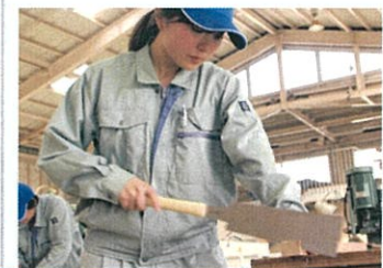
木工家具科(かんな削り・のこ引き)