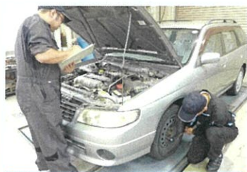
自動車整備科(自動車定期点検)